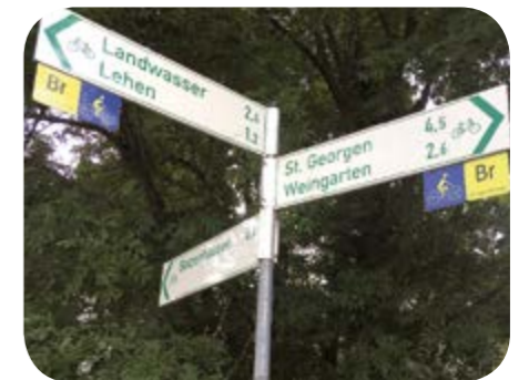
Bild unten: Eines von mehreren offiziellen Radwege-Schildern bei der Gaskugel.