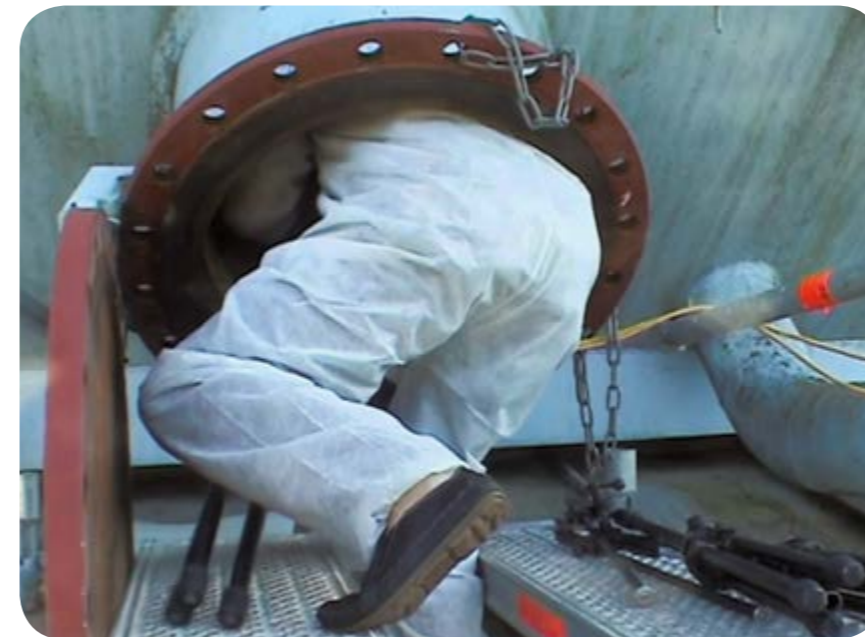
Ein Musiker klettert mit Stativen in die Gaskugel der Stadtwerke von Villingen-Schwenningen, die Kabel für Tonaufnahmen sind gelegt (2003).

Setzen Sie sich mit uns für eine innovative und zukunftsorientierte Stadtentwicklung im Freiburger Westen ein, die Bürger/innen sind es wert!