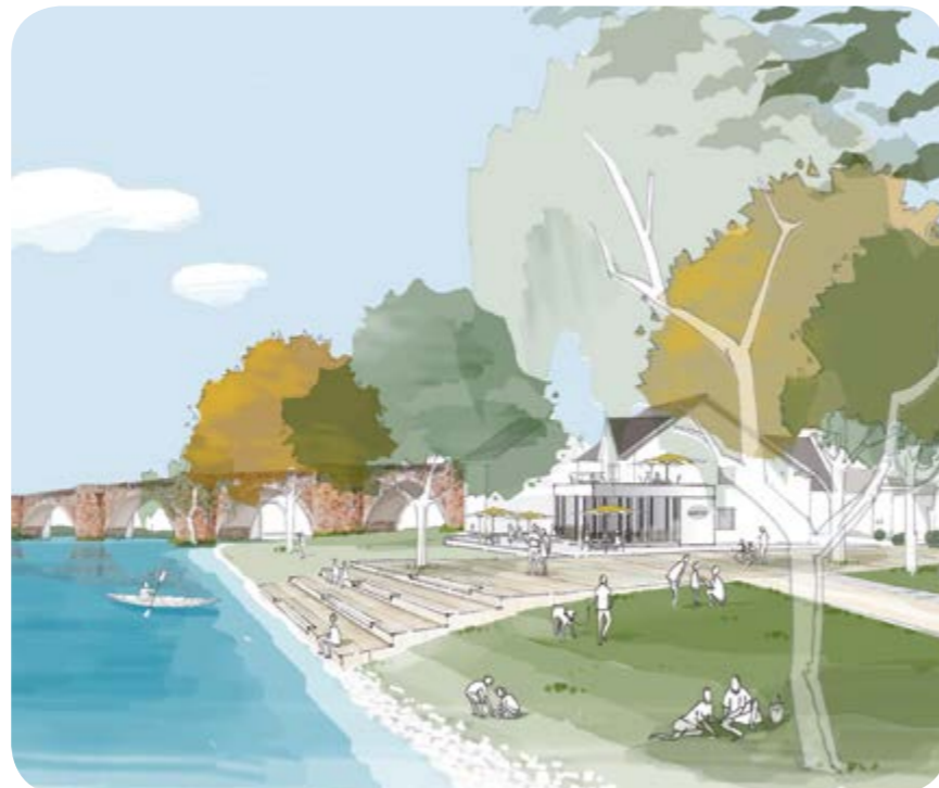
Entwurf für die Umgestaltung des Fulda-Ufers in Melsungen, mit großer Treppe am Café.

Die Kugel ist in ihrer einmaligen Lage, mit ihrer markanten Form, ihrer Größe und ihrer Geschichte für ein Ausflugsziel geradezu prädestiniert.