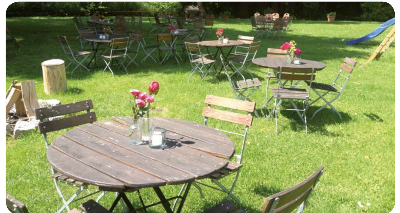
Bio-Gartencafé am Mühlbach in Forstinning / Oberbayern

Dabei wollen wir die Kugel von außen so weit wie möglich in ihrem Originalzustand belassen, als Baudenkmal, mit ihrer jetzigen Bemalung einer Windrose. Sie soll ihr gewohntes und ursprüngliches Erscheinungsbild insgesamt behalten und gleichzeitig neu erlebbar werden. Hier stellt sich eine reizvolle Aufgabe für Architekturbüros.