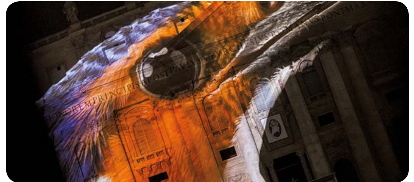
Fiat Lux – Es werde Licht. Illuminating our Common Home | Lichtshow am Petersdom, 2015 | Foto: Giuseppe Lami, picture alliance / dpa ©