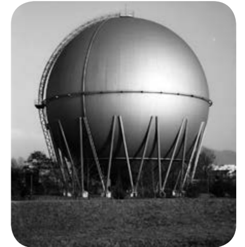
Foto oben: Die Gaskugel 1972.